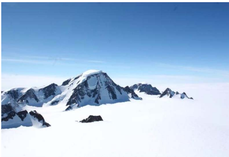
Mount Forel (3402m) parete sud est + ghiacciaio (ca.2200m)