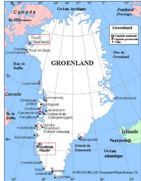
570km da Angmagssalik a Nuuk