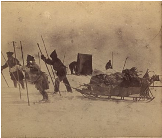
Attraversamento agosto/settembre 1888