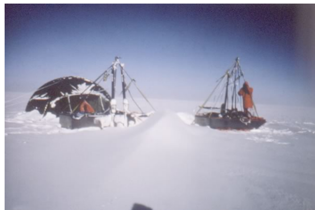
570 km di ghiacciaio a maggio / giugno 2010